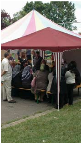
Gruppenarbeit der Generationen

Die härteste Nuss allerdings kam noch: Das Thema „Bolzplatz“. Hier gab es heiße Diskussionen. Mit dem Ergebnissatz „Wir halten uns an die Ruhezeiten“ scheinen letztlich alle leben zu können – wobei eine Skepsis der Senioren nicht zu übersehen war.