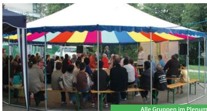
Alle Gruppen im Plenum