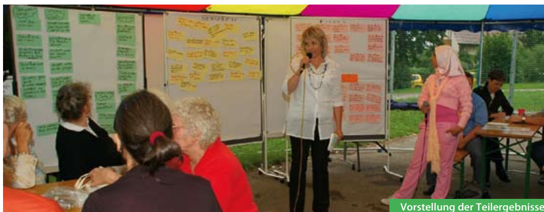
Vorstellung der Teilergebnisse